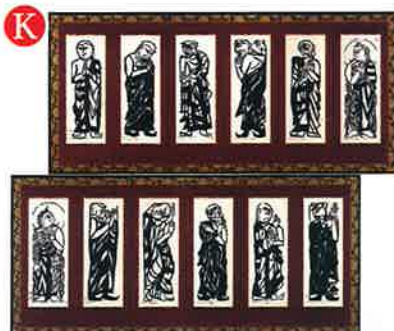
「二菩薩釈迦十大弟子」1939年制作/1948年改刻