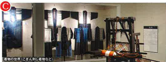
着物の世界(こぎん刺し着物など)